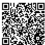
ウェブアンケートページ